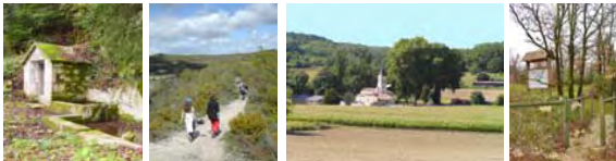
Office de Tourisme Castelnau-

Fête du Chien en Avril-Mai Feu de la Saint Jean en Juin Fête votive début Août Soirées pétanque le vendredi en juillet-Août Repas de l'amitié à Pechpeyroux mi septembre